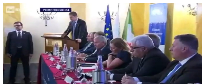
PIANTEDOSI: INFILTRAZIONI NELLE MANIFESTAZIONI STUDENTESCHE

Guarda le intervista sul nostro sito web: