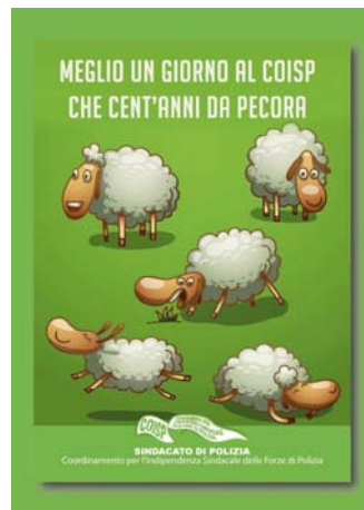
2° classificato – Roberto Doria