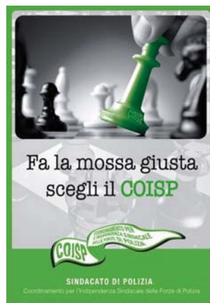
3° classificato ex aequo (MICHELE TAMASI)