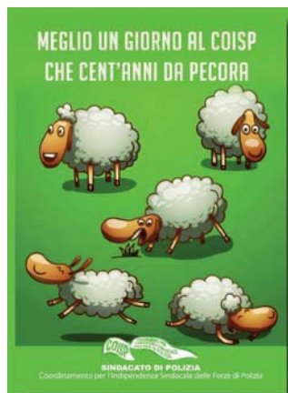
2° classificato (ROBERTO DORIA)