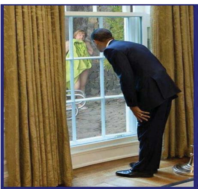
Abbiamo le prove che Obama spiava la Merkel www.nardonardo.it