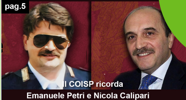
Il COISP ricorda