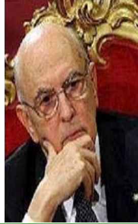
Pepe Mujica Presidente Uruguay

"Dovete fare dei sacrifici per salvare l'Italia, bisogna continuare su questa strada. No a populismi, qualunquismo e demagogia".