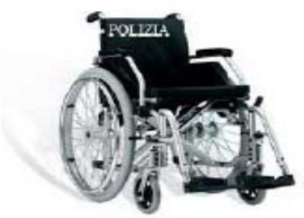
Pantera per poliziotti da 65 a 67 anni