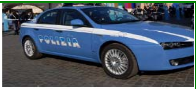
Pantera per poliziotti fino a 40 anni