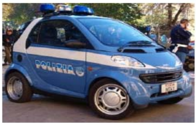
Pantera per poliziotti da 40 a 55 anni