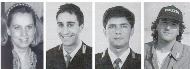
Francesca Morvillo, Vito Schifani, Rocco Di Cillo, Antonio Montinaro

1992 - 2009 Sono trascorsi 17 anni da quel maledetto 23 maggio che segnò uno dei giorni più violenti e cruenti del millennio appena trascorso. 17 anni da quella strage di Capaci che fu un vero e proprio attentato mafioso in cui persero la vita il giudice antimafia Giovanni Falcone, sua moglie