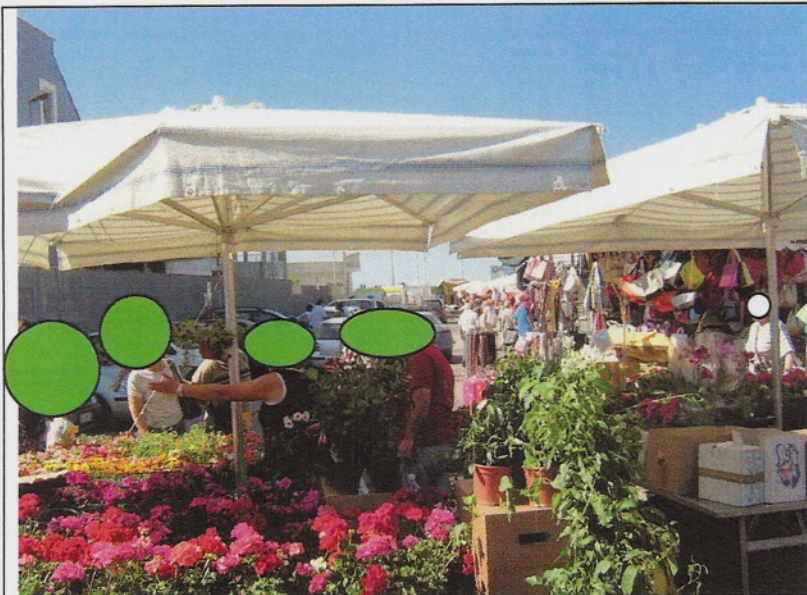
LATO COMMISSARIATO 1